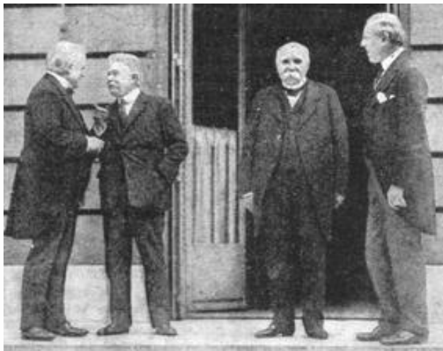
De gauche à droite: David Lloyd George, Vittorio Orlando, Georges Clémenceau et Thomas W. Wilson

Source : http://www.tlfg.ulaval.ca/AXL/francophonie/versailles_1919.htm