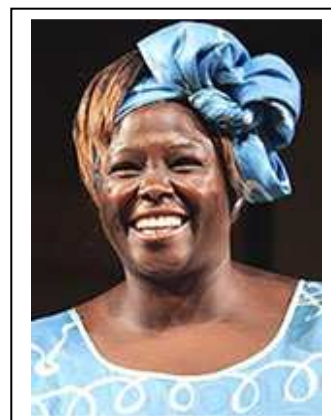
Wangari Muta Maathai