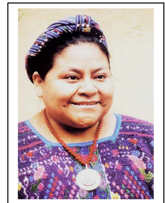
Rigoberta Menchu Tum