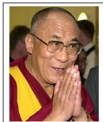
Le dalaï lama